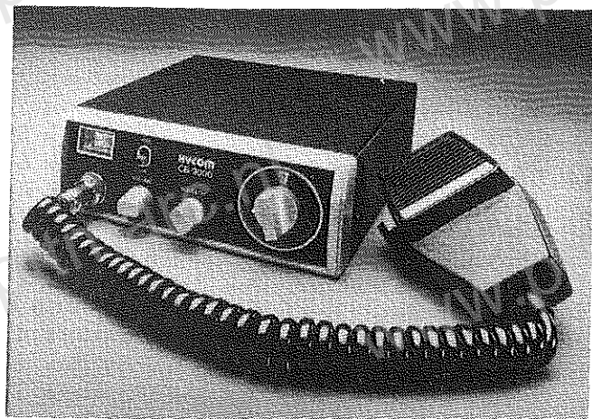
boven: Hycom cb 2000

enkel niet meer zo openbaar. De volgende types waren rond de jaarwisseling ook goedgekeurd.